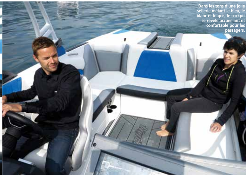
Dans les tons d'une jolie sellerie mêlant le bleu, le blanc et le gris, le cockpit se révèle accueillant et confortable pour les passagers.