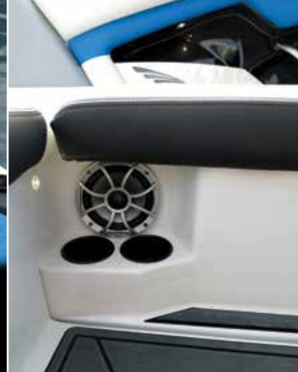
L'une des quatre enceintes du bord pour surfer en musique.