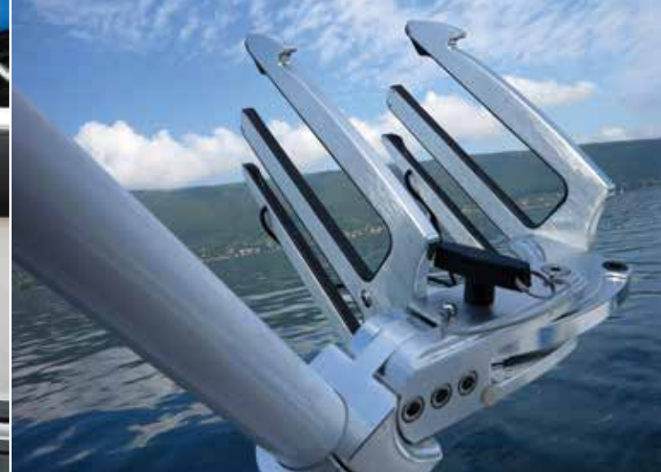
Équipement incontournable pour la pratique du wakeboard et du wakesurf, les racks fixés à la tour sont pivotants et livrés en série.