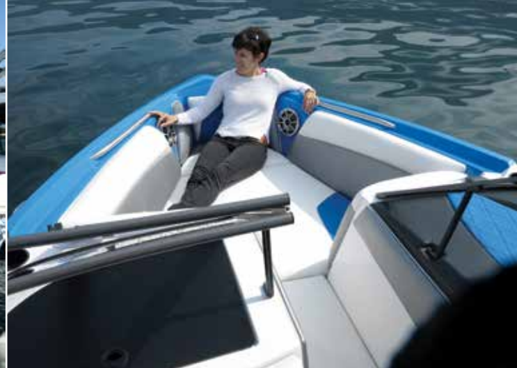
Le bow rider en pointe (1,20 x 1 m), aménagé d'un confortable bain de soleil, est un poste d'observation privilégié à bord.