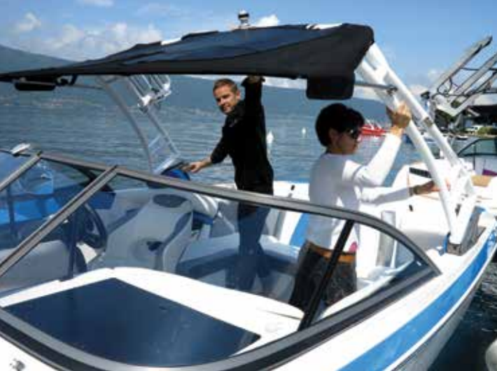
Pour stocker facilement le bateau, la tour de wake se rabat très facilement et le taud de mouillage fait partie de l'équipement standard.