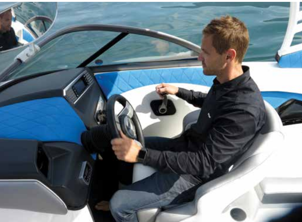
Confortablement calé dans le fauteuil, c'est un vrai bonheur de piloter ce bateau qui dépasse les 38 nœuds en maxi, propulsé par un 400 chevaux Indmar Raptor.