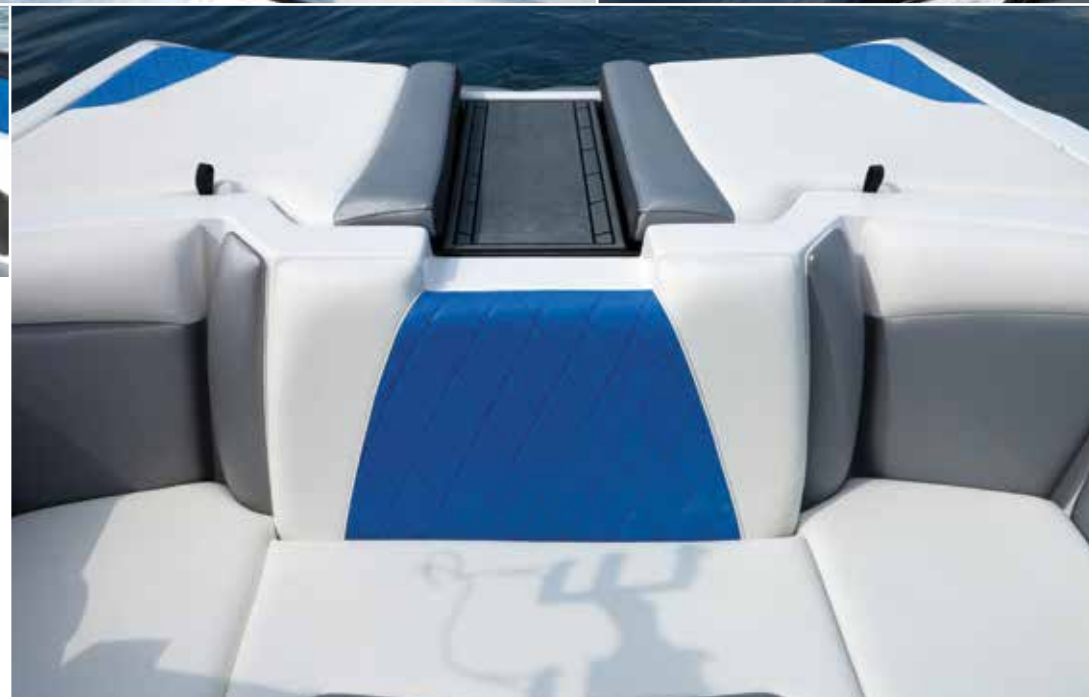
Le coussin central du bain de soleil arrière se retourne pour offrir un passage pour accéder à la plateforme avec un revêtement anti-dérapant.

Hors-Bord Magazine n°63), est de forme convexe. « Le premier avantage de cette coque brevetée est la performance au déjaugage, plus rapide que sur une coque traditionnelle. », explique Renaud Kuppens, nouvel importateur de la marque en France, via sa société Konvex basée en Belgique. « Elle permet aussi de créer l'effet coanda. En y intégrant le Taps 2 dans sa continuité, cela permet de gérer la forme, la taille et le caractère de la vague en fonction de la discipline. Cette forme de coque diminue enfin considérablement la traînée, ce qui per-