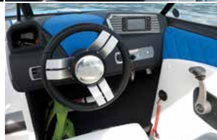
Simplissime, le tableau de bord du R21 est d'une parfaite lisibilité.

Hors-Bord Magazine n°63), est de forme convexe. « Le premier avantage de cette coque brevetée est la performance au déjaugage, plus rapide que sur une coque traditionnelle. », explique Renaud Kuppens, nouvel importateur de la marque en France, via sa société Konvex basée en Belgique. « Elle permet aussi de créer l'effet coanda. En y intégrant le Taps 2 dans sa continuité, cela permet de gérer la forme, la taille et le caractère de la vague en fonction de la discipline. Cette forme de coque diminue enfin considérablement la traînée, ce qui per-