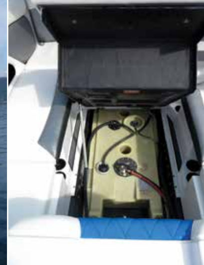
L'accès à toute la partie technique est l'un des points forts de ce bateau.