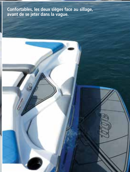
Confortables, les deux sièges face au sillage, avant de se jeter dans la vague.

« A bord du Tigé R21, il n'y a pas d'option cachée », prévient d'emblée Pierre Durin, le patron de l'Atelier du Bateau à Saint-Jorioz au bord du lac d'Annecy, qui vient de reprendre la distribution du chantier américain pour la région Rhône-Alpes. De fait, si le R21 fait partie d'une gamme limitée dans un budget, comparé aux séries Z et RZ du même constructeur, sa version standard n'en n'oublie pas pour autant les fondamentaux d'un bateau destiné au wakeboarder et surfboarder, à commencer par des ballasts XL d'une capacité de près de 1 200 litres qui se remplissent et se vident en une poignée de minutes. Conjugés au système des taps, il y a là de quoi former une belle vague. La solide tour de wake, dotée de racks pivotants et qui s'abaisse en un tour de main pour stocker le bateau, fait aussi partie du lot. Et pour propulser le tout, comptez 400 ch délivrés par un moteur Indmar Raptor V8 de 6,2 l.